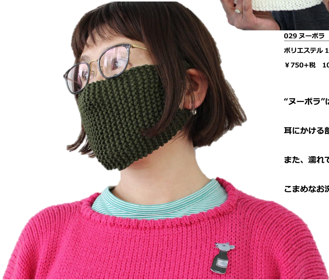
029 ヌーボラ (MADE IN JAPAN)